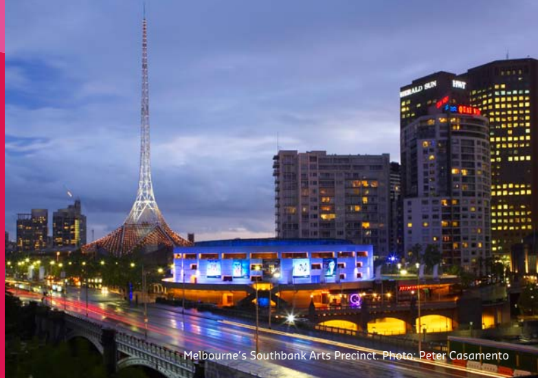
Melbourne's Southbank Arts Precinct.