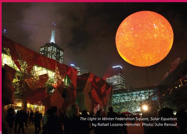
The Light in Winter Federation Square, Solar Equation by Rafael Lozano-Hemmer.