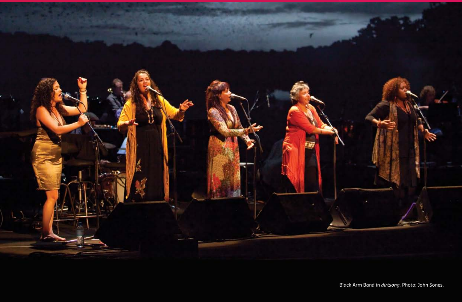
Black Arm Band in dirtsong , Photo: John Sones.

La Federación Internacional de Consejos de Artes y Agencias Culturales y el Australia Council for the Arts, en alianza con Arts Victoria, serán los anfitriones de la 5ª Cumbre Mundial de las Artes y la Cultura.